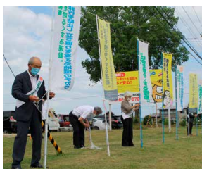
まとまる前道道のぼり設置